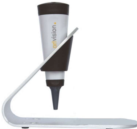
Otoskop i hållaren